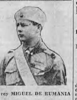
El rey MIGUEL DE RUMANIA quien ayer ascendió al trono por abdicación de su padre el rey Carol