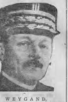
WEYGAND, va al Africa, a predicar la razón al imperio inquietado por De Gaulle

El movimiento que un grupo de franceses, encabezados por el ex-subsecretario de guerra en tiempo del gobierno de Daladier, general Charles De Gaulle, ha tenido un eco que posiblemente no sospecharán las gentes; la llamada a las colonias francesas, especialmente al imperio francés africano ha sido contestada de acuerdo por muchos hombres y en cuenta por las tropas francesas y nativas en esas posesiones.