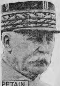
PETAÏN, ahora racionador en Francia.